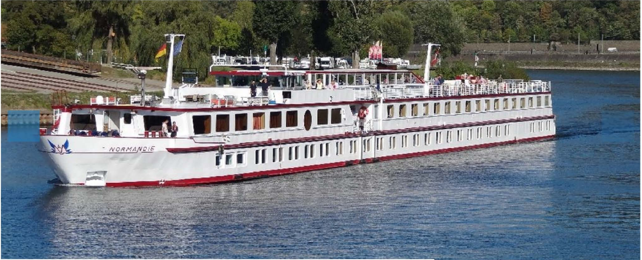
MS Normandie - Flusskreuzfahrt mit Hund